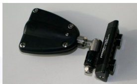
Coulisseau de latte Ronstan à billes