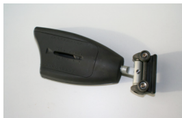
Coulisseau de latte Rutgeron à roulettes