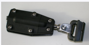
Coulisseau de latte Sailman